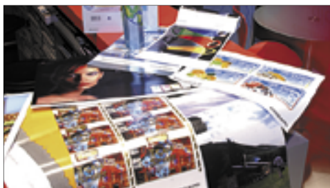
Abb. 4: Heidelberger Druckmaschinen AG

So arbeiten Layout- und EDV-Fachleute Hand in Hand.