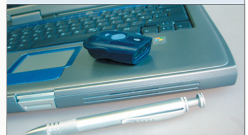
↳ Mini-Barcode-Scanner S-1