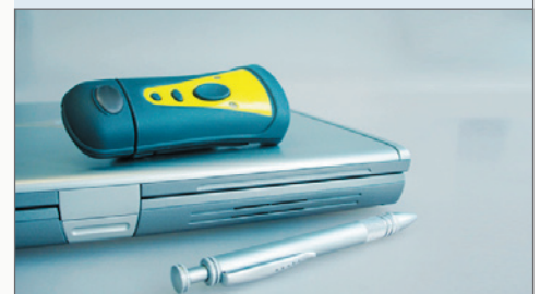
↳ Midi-Barcode-Scanner P-1