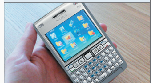
↳ Smartphone E61i