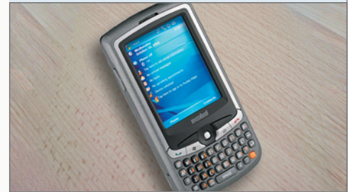
↳ Management PDA MC35

Jedes Modul kann separat aktiviert und konfiguriert werden.