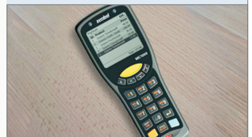
↳ Industrial MDE MC1000