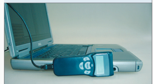
↳ Midi-Barcode-Scanner Z-2