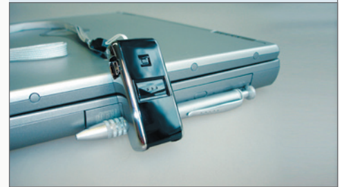
↳ Mini-Barcode-Scanner O-1

Dieses strukturierte Vorgehen hat sich vielfach bewährt. Neben großen Unternehmen arbeiten auch viele kleine und mittlere Betriebe mit unseren Produkten.